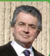
Alain Claeys Député